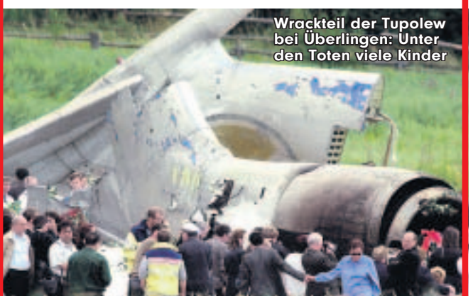
Wrackteil der Tupolew bei Überlingen: Unter den Toten viele Kinder

Das Urteil ist knallhart: Deutschland soll für die Fehler der Schweizer Flugsicherung „skyguide“, die u.a. zum Flugzeug-Absturz bei Überlingen führten, haften. Das Landgericht Konstanz begründete die Entscheidung damit, daß Deutschland (Bundesverkehrsministerium) „rechtswidrig den Schweizern die Aufsicht über Teile des deutschen Luftraums überlassen hat“. Im Juli 2002 starben überm Bodensee 71 Menschen, nachdem eine Tupolew und eine DHL-Frachtmaschine zusammengestoßen waren. Die russische „Bashkirian Airlines“ hatte auf Schadensersatz geklagt. Nach dem Urteil soll die Regierung nun nicht nur die zerstörte Maschine ersetzen, sondern auch für die Forderungen der Hinterbliebenen der Toten aufkommen.